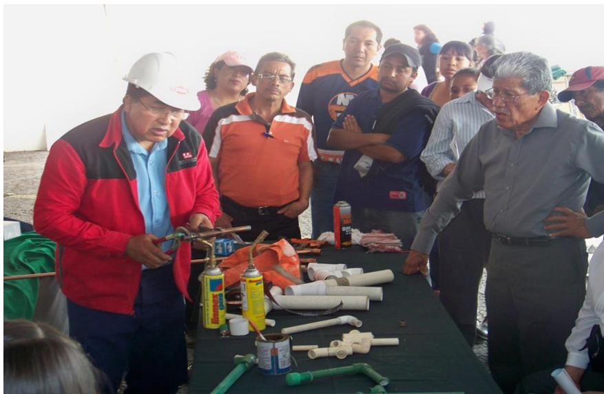
Cursos de Plomería y Electricidad en el Día Internacional de las Mujeres organizado por INMUJERES en el Zócalo de la Cd. De México.